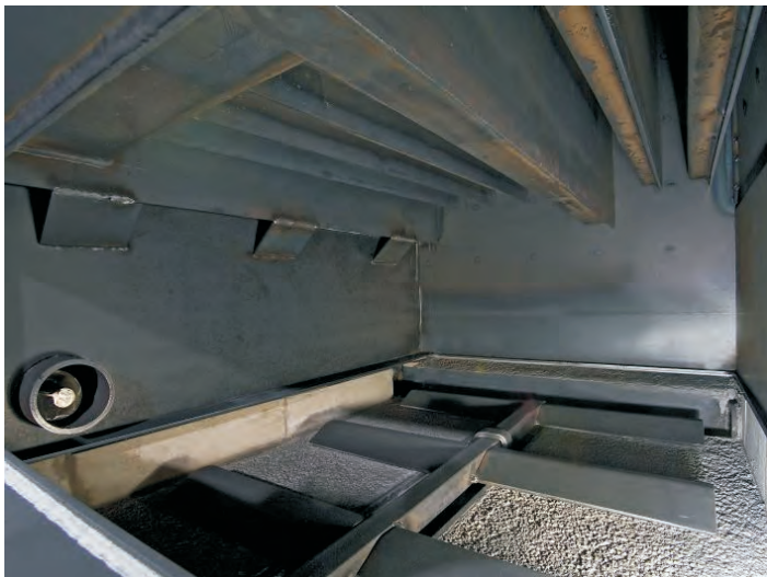
Innenansicht: Schubrechen für Entaschung

■ Automatische Komplettentaschung durch hydraulischen Schubboden (als Option)