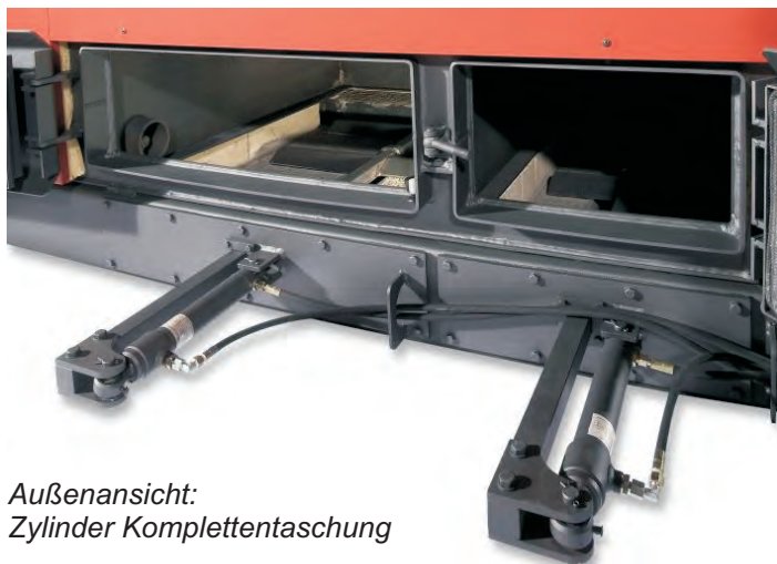
Außenansicht: Zylinder Komplettentaschung

E-Mail: info@nolting-online.de Internet: www.nolting-online.de