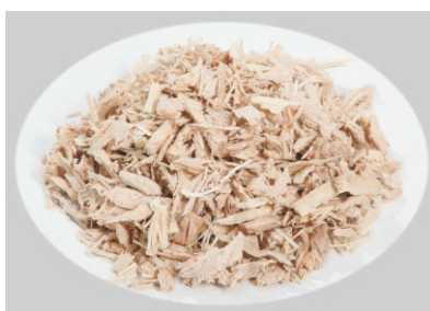
Hackschnitzel aus der Holzverarbeitung und bearbeitung

■ Die Siloaustragung S 151 ist für Holzspänebrennstoffe einschließlich Hackschnitzel bis 20 mm Schnittlänge geeignet. Die Schnitzeldicke soll 5 mm nicht überschreiten.